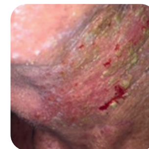
4 stopień - nasilone zmiany skórne, samoistne krwawienie, zakażenia bakteryjne i grzybicze.