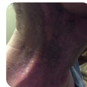
2 stopień - wyraźny rumień, złuszczenie na sucho, delikatny obrzęk